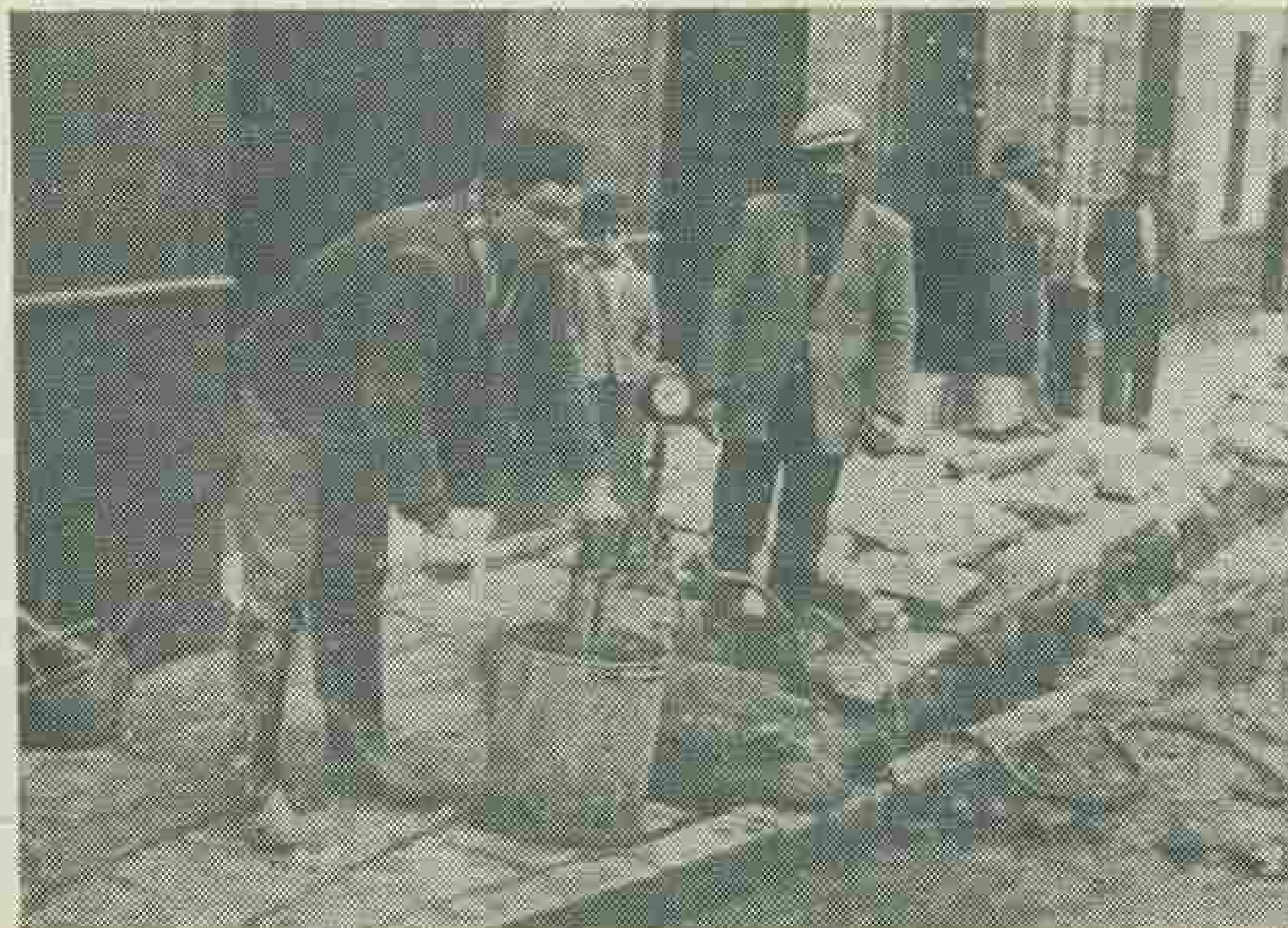
Las tuberías de conducción de agua, son comprobadas por tramos a una presión de 10 atmósferas.

Todas las calles principales tendrán alcantarillado teniendo éste una profundidad mínima de 1'20 metros, para evitar contaminaciones, ya que como decimos al principio de esta información van en la misma zanja ambas